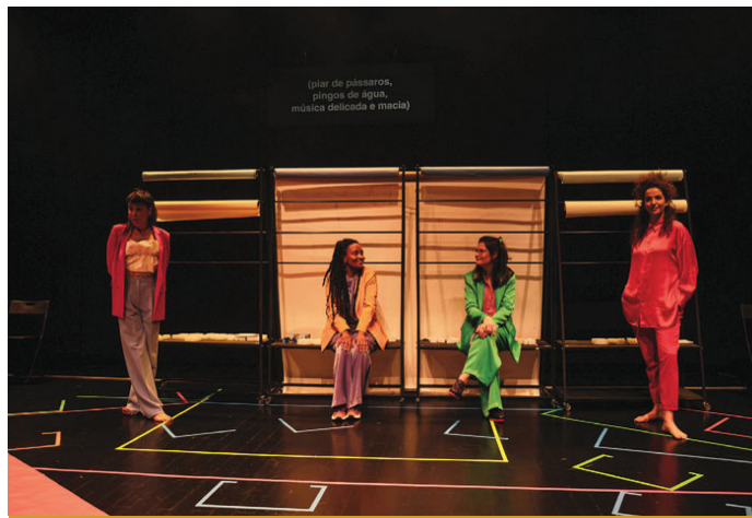
Outra Língua, no palco do Teatro Virgínia, em Torres Novas

E Estudo, Conservação e Restauro dos Painéis de São Vicente 2020/2023 até 18 de maio