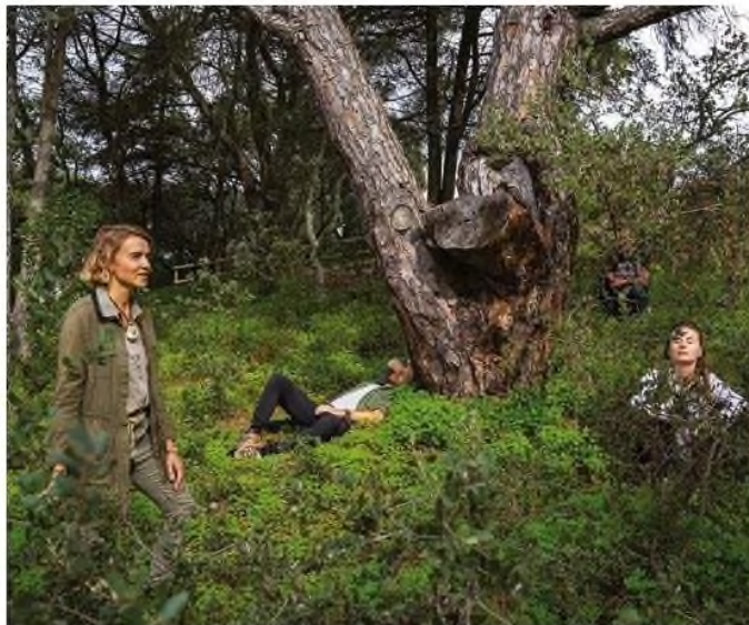
ESTUFA FRIA 17 DE MAIO A 27 DE AGOSTO PARQUE EDUARDO VII / WWW.ETERNALFOREST.EARTH