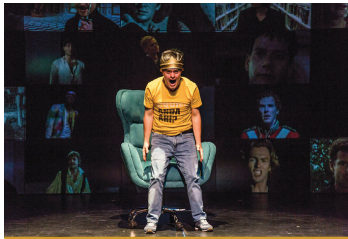
Hamlet, no palco do Teatro Nacional São João, no Porto

E Jorge Barradas nos Jardins da Europa Retrospectiva de Jorge Barradas. até 27 de agosto E Veloso Salgado: de Lisboa a Wissant até 20 de setembro